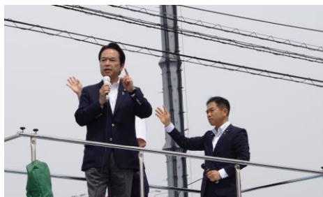
国民の皆様と共に力を合わせることが、日本の国益・国民の安全な生活を堅持する政治を実現する原動力です。