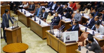
国会終盤、主戦場の予算委員会。政策をしっかりと聴取・精査し、よりよい国の形をつくって参ります。