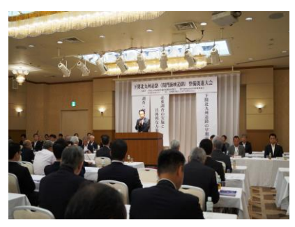
下関北九州道路整備促進大会。地域経済の発展もまた、地域を繋ぐ道路が不可欠であります。