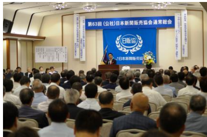
日本新聞販売協会でのご挨拶。国民が格差なく平等に知る権利を得ることは、とても重要なことです。