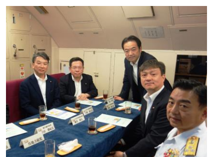
旧海軍時代からの主要基地、広島の大田原地区部隊を視察。最前線で領土の平和を守ります。