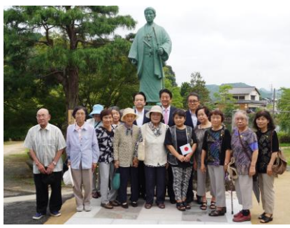
安倍総理の随行で、高杉晋作墓所の東行庵。たくさんの方々にお出迎えいただき、心より感謝です。