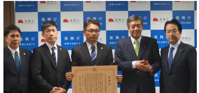
東日本大震災の「奇跡の一本松」から彫りだした「復興大臣公印」を竹下大臣に寄贈。このプロジェクトに最初から関わっていただけに感無量です。