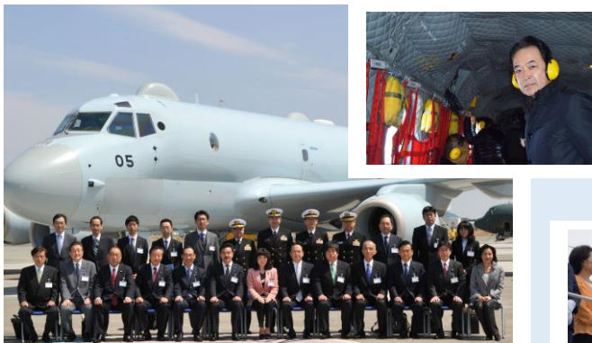
外交防衛委員会視察で厚木基地を訪ねる。日々の厳しい訓練が、日本の安全を支えます。