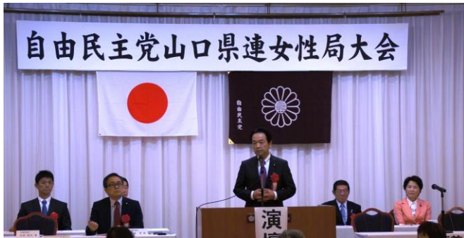
自由民主党女性局大会にて挨拶。 成長戦略の柱として、女性の活躍推進は必要不可欠です。女性が輝く社会の実現に向けて頑張ります。