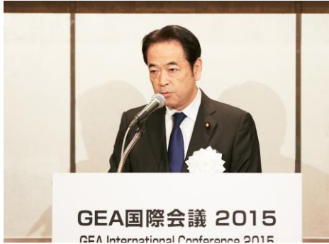
GEA国際会議 2015 GEA International Conference 2015

地球環境行動会議は、地球温暖化など人類存続危機を具体的に回避する策を協議する極めて重要な国際会議です。丁寧かつ迅速な対応が求められます。